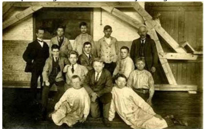
Bijscript: acht metselaars en drie schilders.

mag zich bijzonder in de belangstelling van de leerlingen verheugen, want kort voor de eeuwwisseling is het aantal dermate groot geworden dat deze afdeling drastisch moet worden uitgebreid (1899/1900 80 leerlingen, 1900/01140). Door de praktijklokalen van de ververij, de metselafdeling en de smederij onderling te verwisselen, kan de smederij worden vergroot tot 4 dubbele vuren, waarmee men voorlopig kan volstaan. De ingebruikneming van een stoommachine, grotendeels door de leerlingen zelf vervaardigd, eist een schoorsteen van 25 m hoogte op een 6 m diepe fundering. Doordat zich steeds meer leerlingen melden, moeten ieder jaar jongens - hoewel